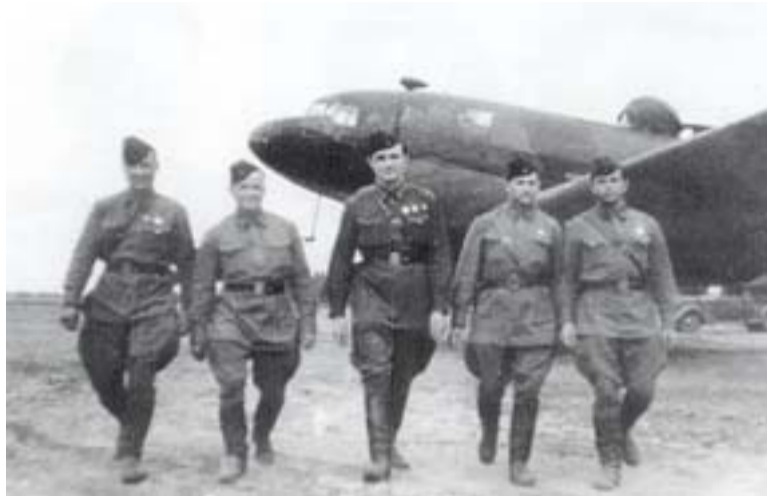
Экипаж транспортного самолёта Ли-2